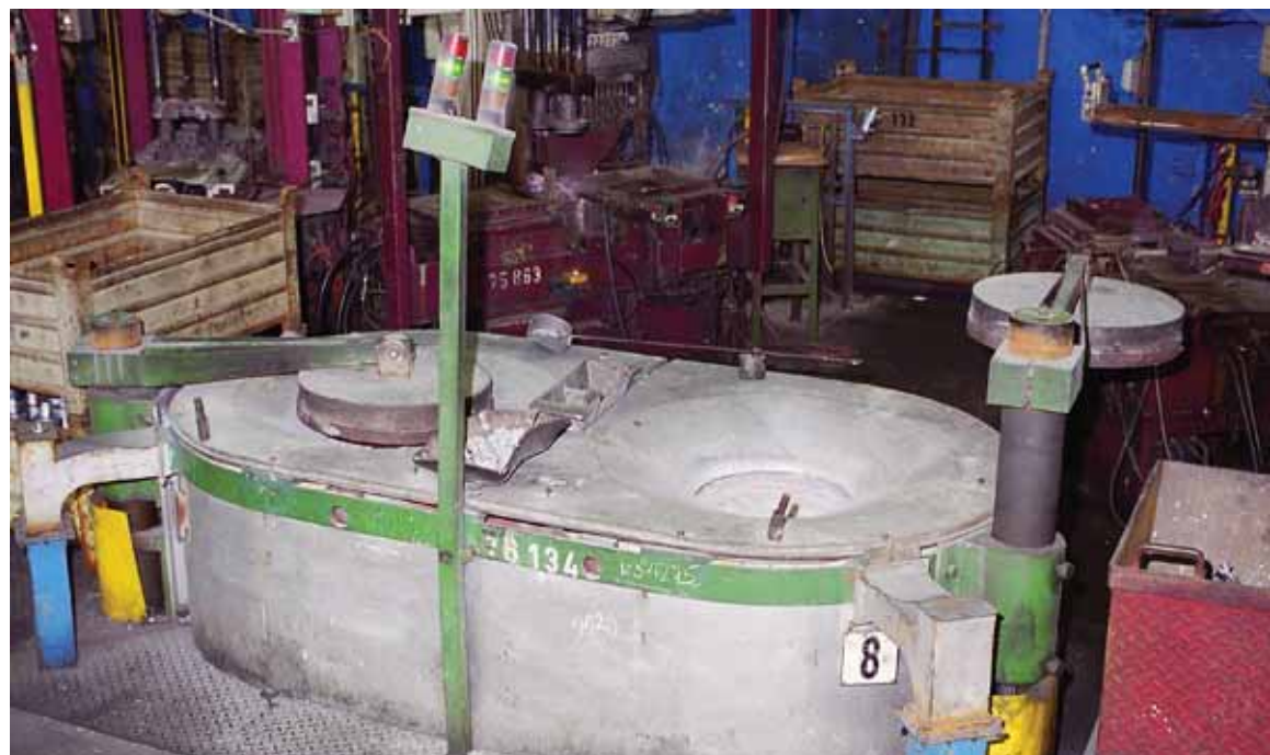
Dvoukelímková tavicí a udržovací pec / Twin-crucible melting and holding furnace

Each crucible is covered with a turning cover. Temperature of each crucible is controlled separately, measured by thermocouple sensors.