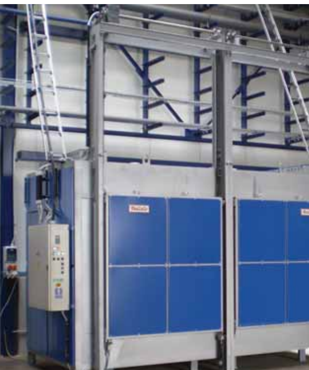
Komorová pec | Chamber furnace

The temperature is measured with thermocouples and controlled by microprocessor controllers, programmable controllers with PC communication or supervisory computer system. Power control by solid state relay, thyristor units or contactors. Electric equipment and control devices are placed separately in the switchboard. REALISTIC furnaces in combination with quenching tanks are designed especially for hardening workshops. Double-walls oil, polymer or water tanks are fitted with external cooler or heating and fume exhausting, if necessary.