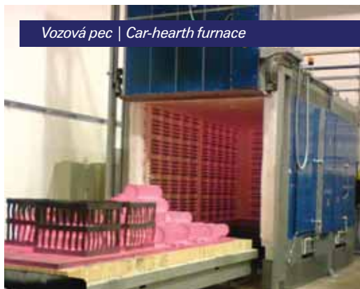
Vozová pec | Car-hearth furnace

A fan may be added to the system to increase the intensity of the air exchange.